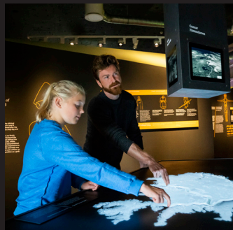
Ferðir til þings